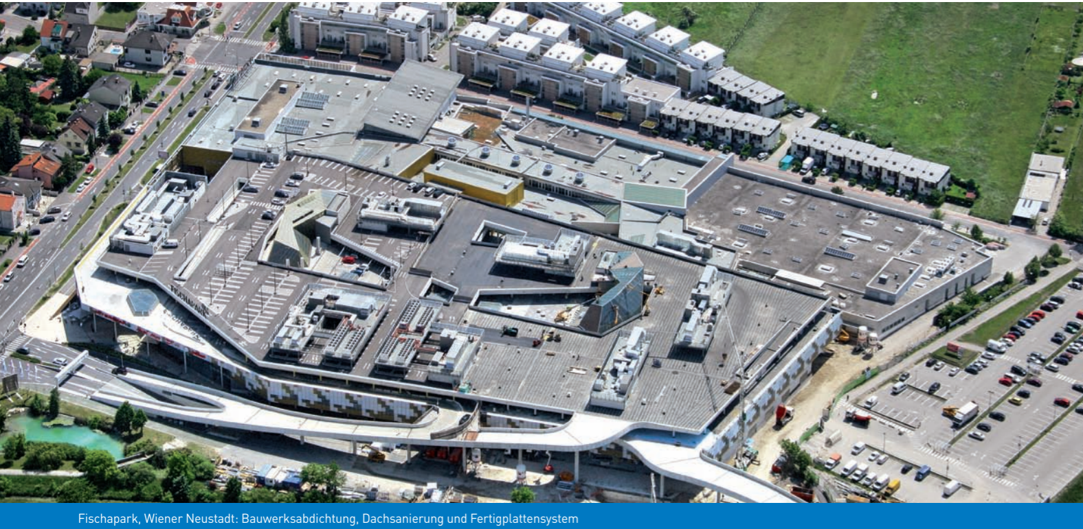
Fischapark, Wiener Neustadt: Bauwerksabdichtung, Dachsanierung und Fertigplattensystem