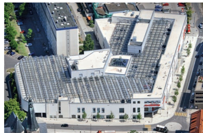
Shoppingcenter Nordhausen: Bauwerksabdichtung und Fertigplattensystem

Auch der Unternehmensbereich SCHWEIGER PARKDACHSYSTEME profitiert von der langjährigen und umfassenden Erfahrung im Flachdachbau. Diese optimalen Synergien nutzen wir für die erfolgreiche Realisierung von Parkdecks, Parkdächern und Tiefgaragen, die auf eine hohe Wirtschaftlichkeit und Beständigkeit ausgelegt sind.