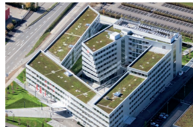
Swiss Life, Garching: Dachabdichtung, Dachbegrünung

Dabei stehen wir langfristig zu unserer Qualität und geben Ihnen auf Anfrage – und in Verbindung mit einem Wartungsvertrag – eine Gewährleistungsgarantie für 10 Jahre und mehr.