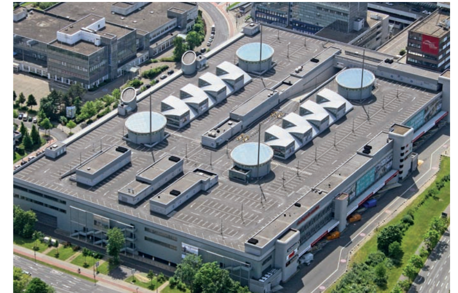
Rheinparkcenter, Neuss: Bauwerksabdichtung und Gußasphaltsystem

Wir beraten Sie ausführlich und kompetent über die verschiedenen Herstellungs- und Sanierungsmöglichkeiten von Parkdächern oder Parkdecks. Darüber hinaus informieren wir Sie über unterschiedliche Techniken, die sowohl ökonomisch ausgerichtete Varianten als auch Premiumqualität abdecken. Die vielfältigen Möglichkeiten werden nahezu jeder Anforderung gerecht.