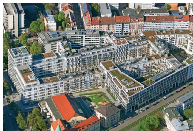
Nymphenburger Höfe, München: Dachabdichtung, Dachbegrünung Tiefgaragenabdichtung

Seit über 50 Jahren realisiert die Rudolf Schweiger Abdichtung und Isolierbau-GmbH & Co. KG anspruchsvolle Flachdächer und Bauwerksabdichtungen. Als ein auf Großprojekte spezialisiertes Fachunternehmen für Flachdachbau verfügen wir über viel Erfahrung und Expertise in der Errichtung und Sanierung von Flachdächern, Parkdecks und Parkdächern.