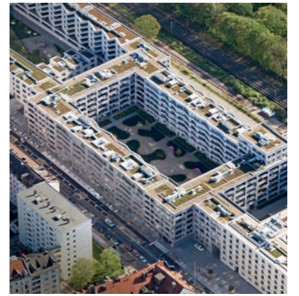
Löwen-/Regerhöfe, München: Dachabdichtung

Die Sanierung von industriellen Flachdächern erfordert die Fachkompetenz eines Spezialisten und setzt eine sorgfältige und umsichtige Vorgehensweise voraus. Daher basieren die Sanierungskonzepte der SCHWEIGER FLACHDACHBAU zunächst auf einer genauen Schadensanalyse – wenn nötig bis zur Laboruntersuchung.