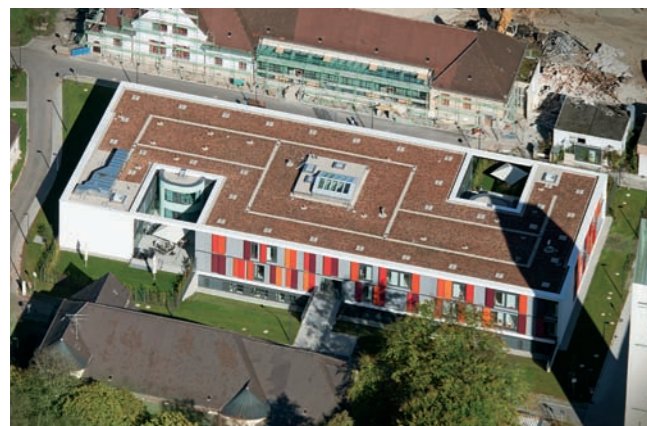
Isar Amper Klinikum: Dachabdichtung, Dachbegrünung