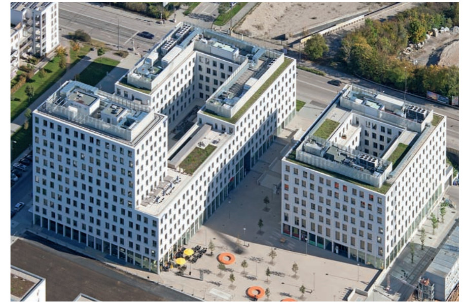
Forum am Hirschgarten, München: Dachabdichtung, Bauwerksabdichtung

Als kompetenter Ansprechpartner für Bauträger, Baufirmen, Generalunternehmer, Architekten und Fachplaner entwickeln wir gemeinsam mit Ihnen Lösungen, die wir effizient und flexibel umsetzen. Dabei begleiten wir Sie durch alle Phasen der Realisierung, von der Beratung bei der Planung und Projektierung bis hin zur professionellen Ausführung.