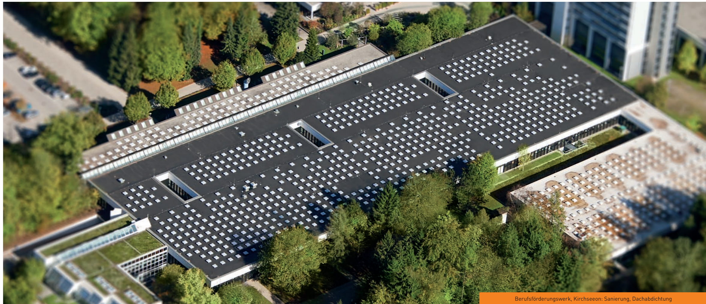
Berufsförderungswerk, Kirchseeon: Sanierung, Dachabdichtung