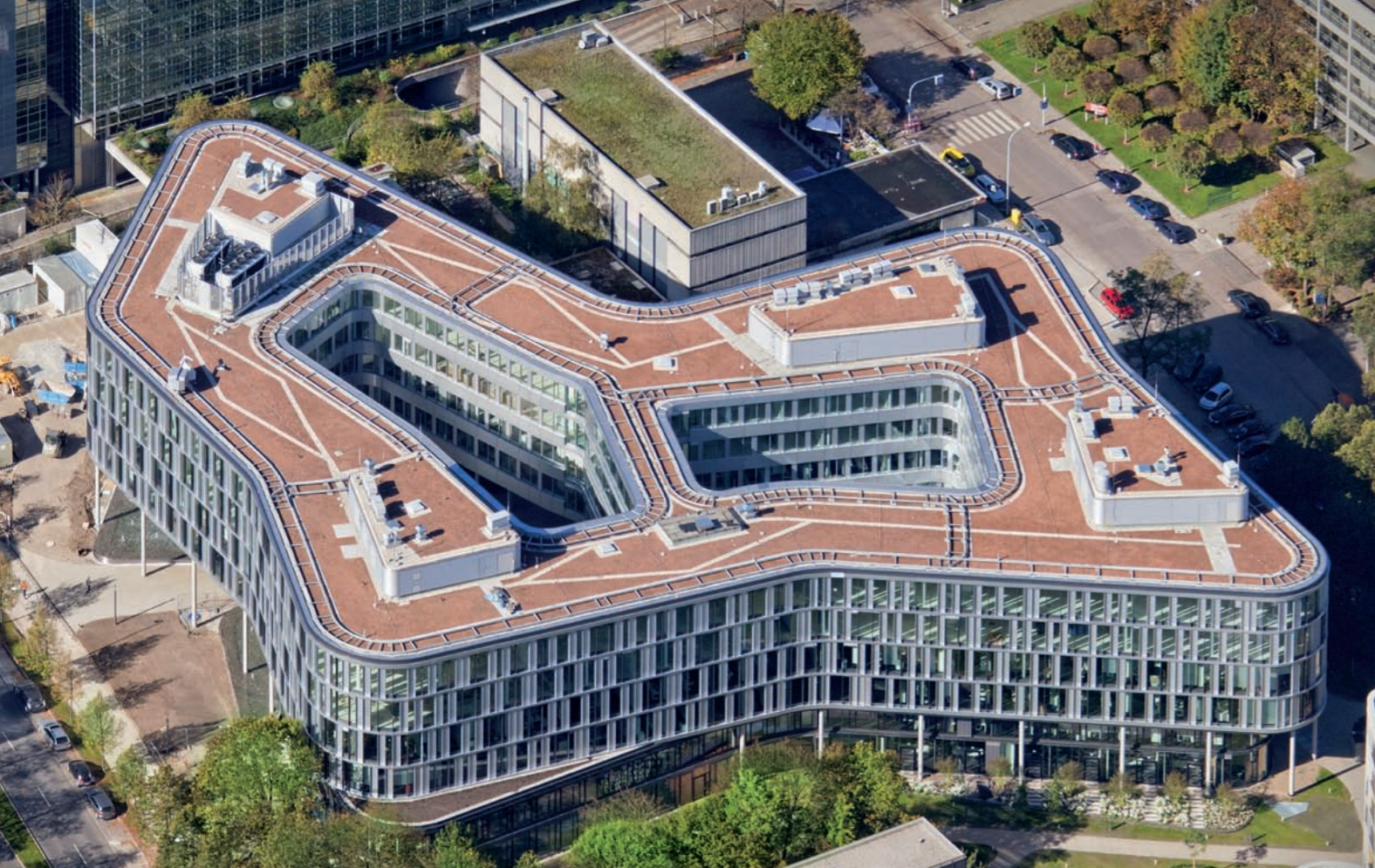
Arabeska, München: Dachabdichtung, Dachbegrünung

Als kompetenter Ansprechpartner für Bauträger, Baufirmen, Generalunternehmer, Architekten und Fachplaner entwickeln wir gemeinsam mit Ihnen Lösungen, die wir effizient und flexibel umsetzen. Dabei begleiten wir Sie durch alle Phasen der Realisierung, von der Beratung bei der Planung und Projektierung bis hin zur professionellen Ausführung.