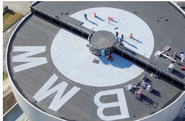
BMW, München: Sanierung, Dachabdichtung

Wir sorgen dafür, dass die optimale technische Lösung zum vorgegebenen Kostenrahmen passt.