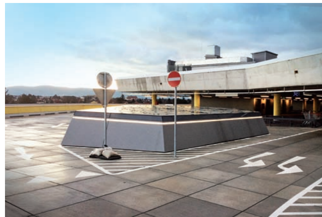
Liborie Galerie, Paderborn: Sanierung, Bauwerksabdichtung, Fertigplattensystem

Auch der Unternehmensbereich SCHWEIGER PARKDACHSYSTEME profitiert von der langjährigen und umfassenden Erfahrung im Flachdachbau. Diese optimalen Synergien nutzen wir für die erfolgreiche Realisierung von Parkdecks, Parkdächern und Tiefgaragen, die auf eine hohe Wirtschaftlichkeit und Beständigkeit ausgelegt sind.